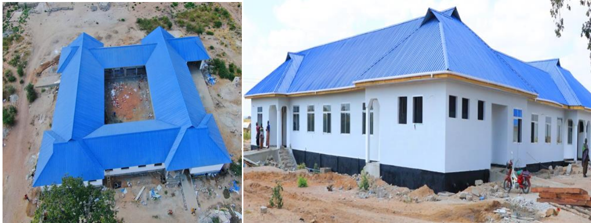
Jengo la Hospitali ya Wilaya