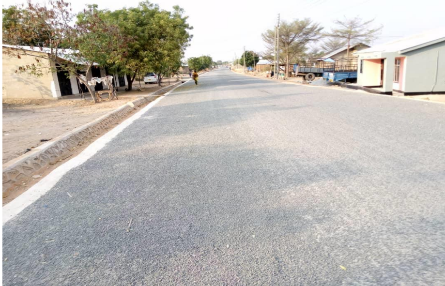
Barabara za lami Km. 2.3 mji wa Bahi