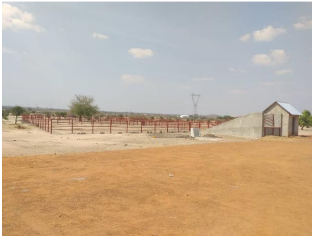
Kituo cha Ukaguzi wa mifugo

Sasa nakuomba uzindue rasmi kituo hiki cha Ukaguzi wa Mifugo kilichopo eneo la mnada wa Bahi kwenye mji wa Bahi.