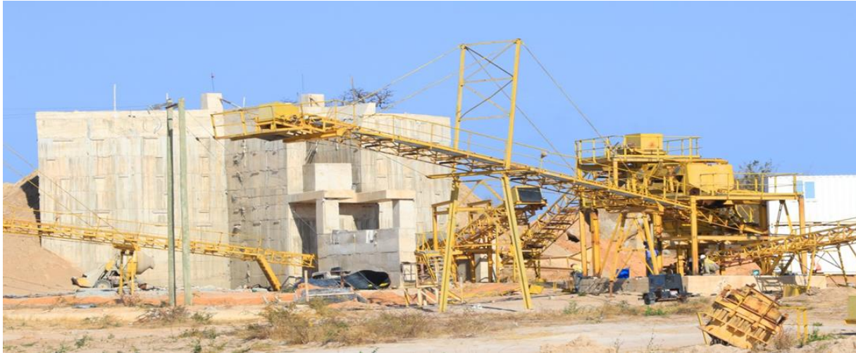
Kiwanda cha uzalishaji kokoto Kampuni ya KASCCO Mundemu