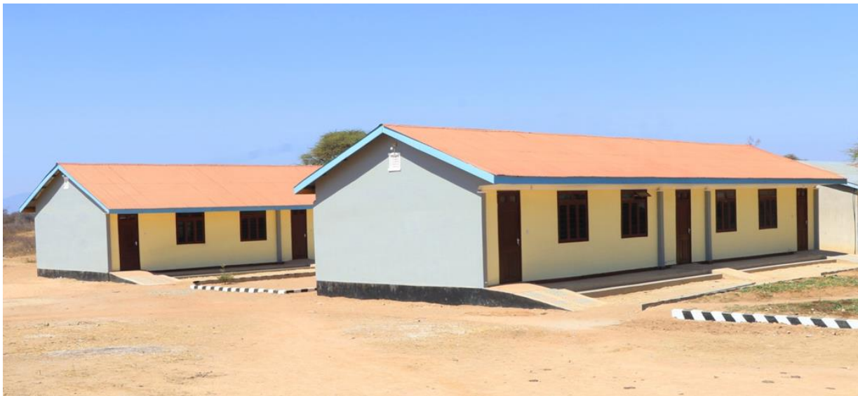
Vyumba vinne vya madarasa shule ya sekondari Mundemu

Kwa heshima na taadhima tuanakuomba sasa uweze kuzindua mradi wetu .