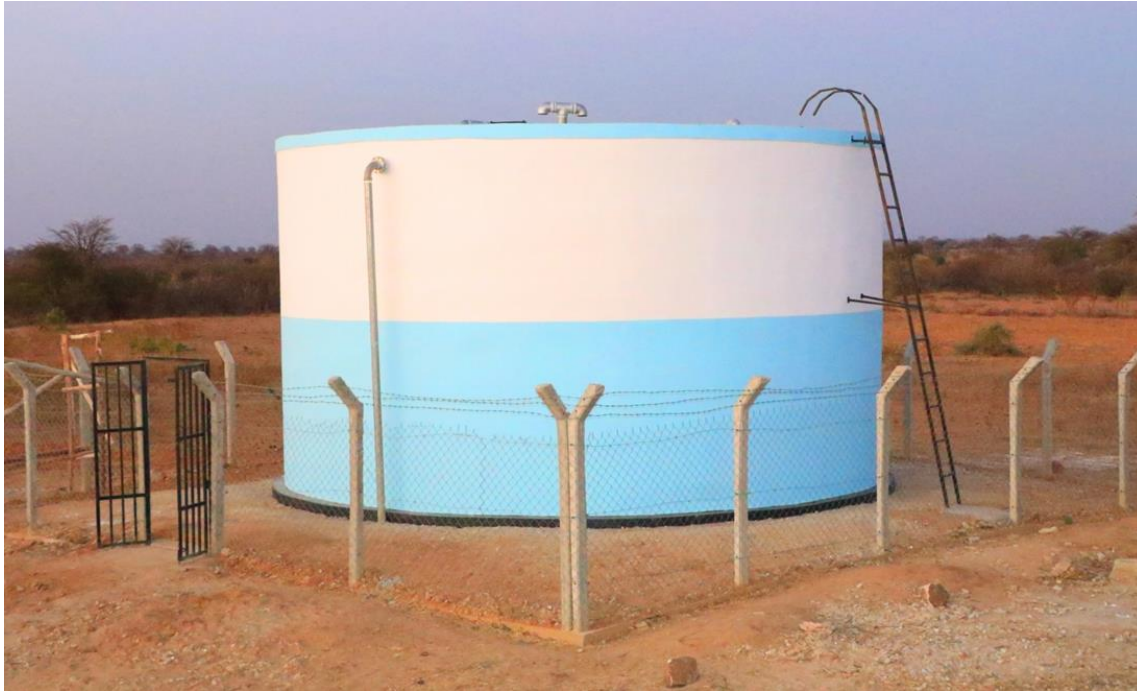
Tanki la Maji kijiji cha Mkakatika